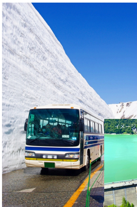
室堂・雪の大谷ウォーク