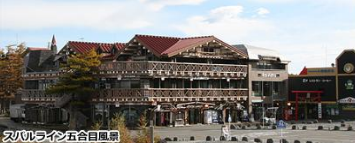
スバルライン五合目風景